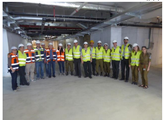
סיכום הסיור באתר