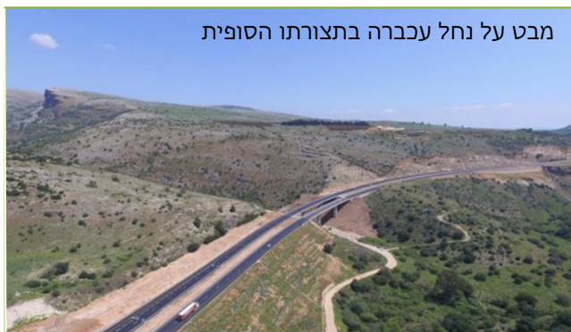
מבט על נחל עכברה בתצורתו הסופית

בתמונה (מימין לשמאל): אורלי אינדיצקי, משה טאובין, אהוד דנוך, גבריאל טרכטנברג וראובן לבאון מהאיגוד