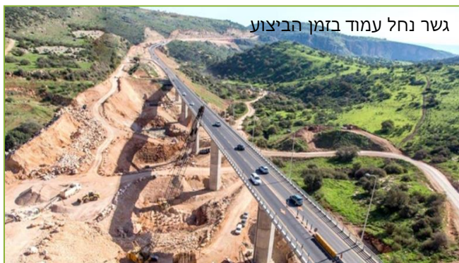
גשר נחל עמוד בזמן הביצוע

בחדש החולף התקיים הכנס ה-10 לבנייה ותשתיות מטעם איגוד המהנדסים. בכנס הוענקו פרסי הצטיינות בתחום התשתיות והתחבורה לשנת 2017. שני פרסים הוענקו לשיכון ובינוי סולל בונה